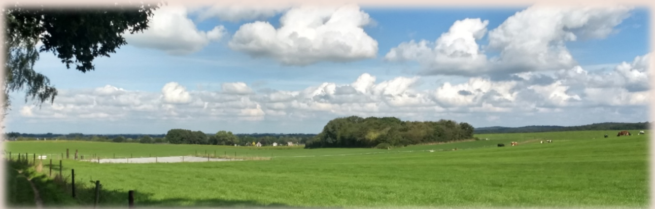
Ons landschap. Kan het nóg mooier?