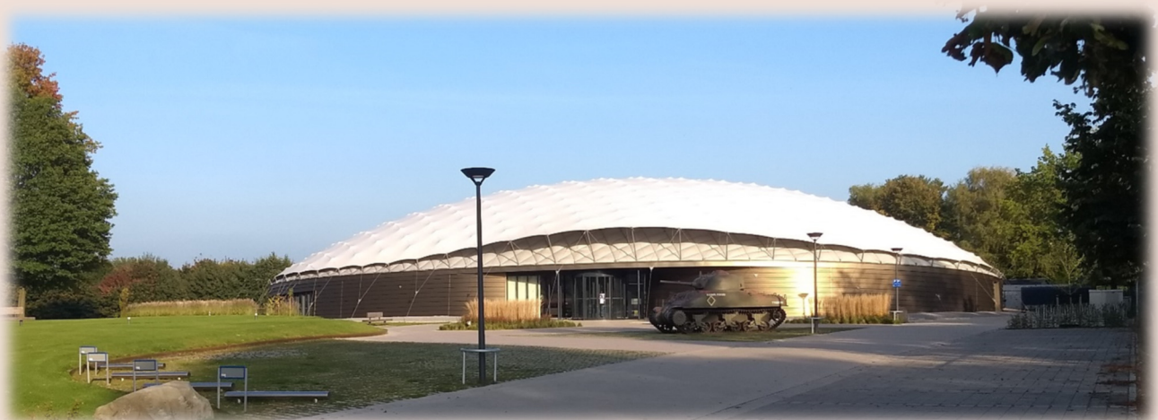
Onze vrijheid verbindt ons.